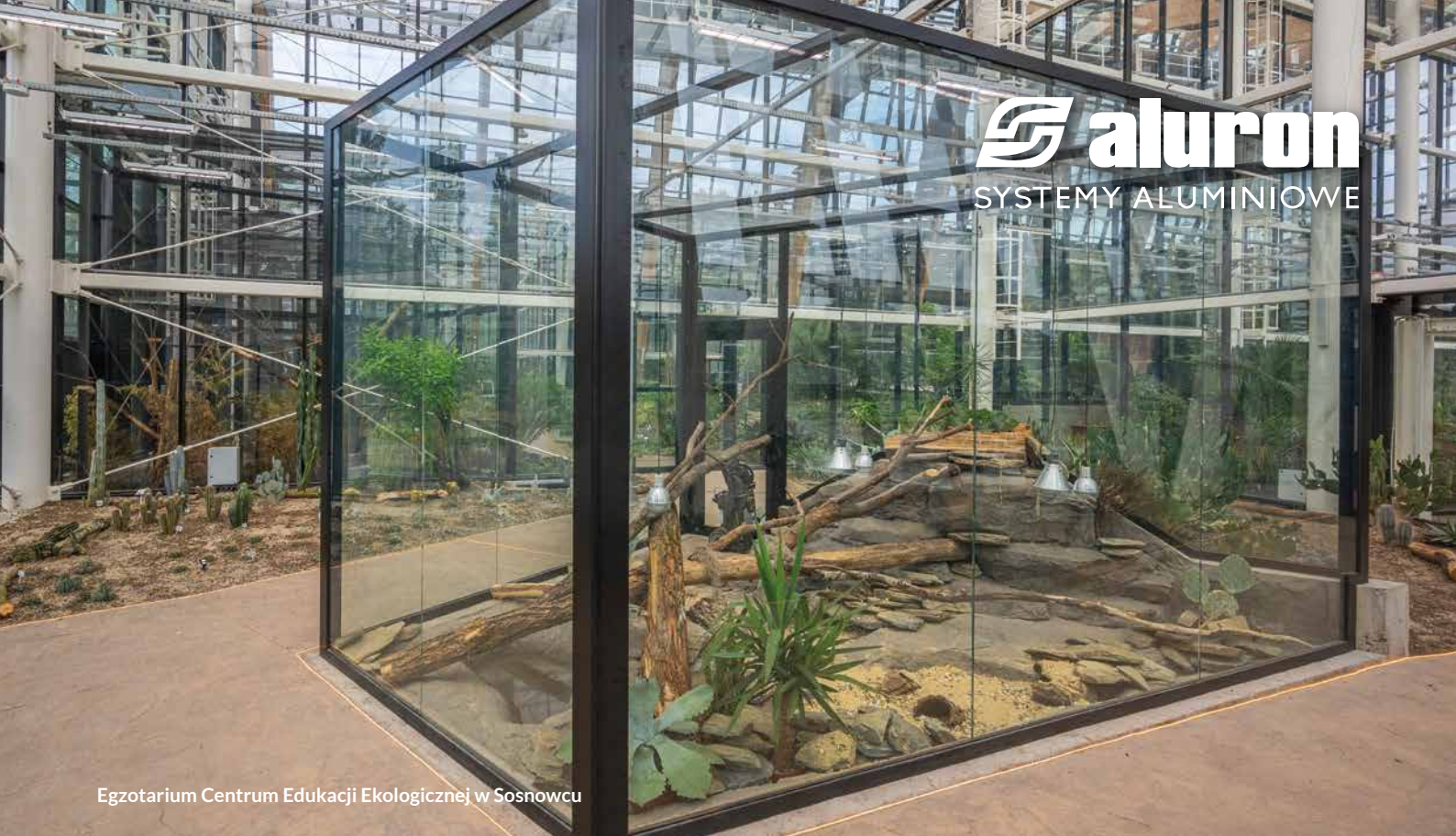
Egzotarium Centrum Edukacji Ekologicznej w Sosnowcu